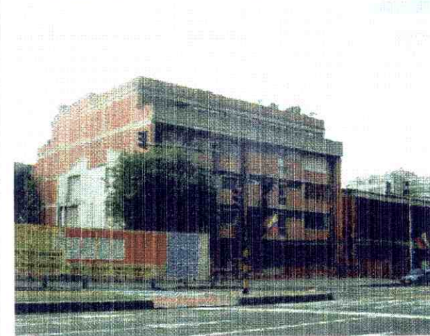
ALTERACIONES A LA EDIFICACION ORIGINAL VISIBLES DESDE EL EXTERIOR :